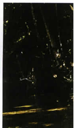
Un belvédère sur la Bloomfield Track donnant une vue spectaculaire sur la Daintree River.