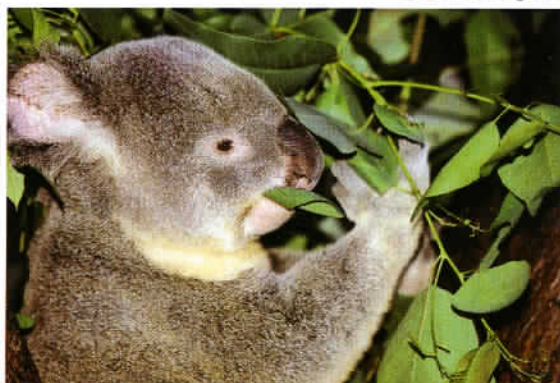
Koalas et kangourous sont aussi visibles au Rainforest Habitat Wildlife de Port Douglas.